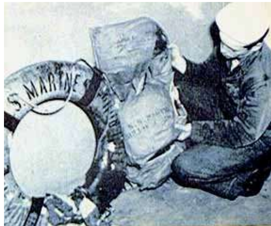
Garde côte tenant un gilet de sauvetage et une bouée venant d'être repêchés et appartenant au SS Marine Sulphur Queen